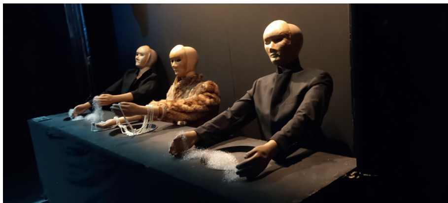
Fot. 9. Wystawa Światło i mrok . Teatr Leszka Mądzika, rekonstrukcja fragmentu sceny ze spektaklu Lustro , fot. I. Brandys, Katowice 2025