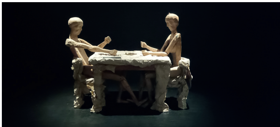
Fot. 5. Teatr Leszka Mądzika , rekonstrukcja fragmentu sceny ze spektaklu Pętanie , fot. I. Brandys, Katowice 2025