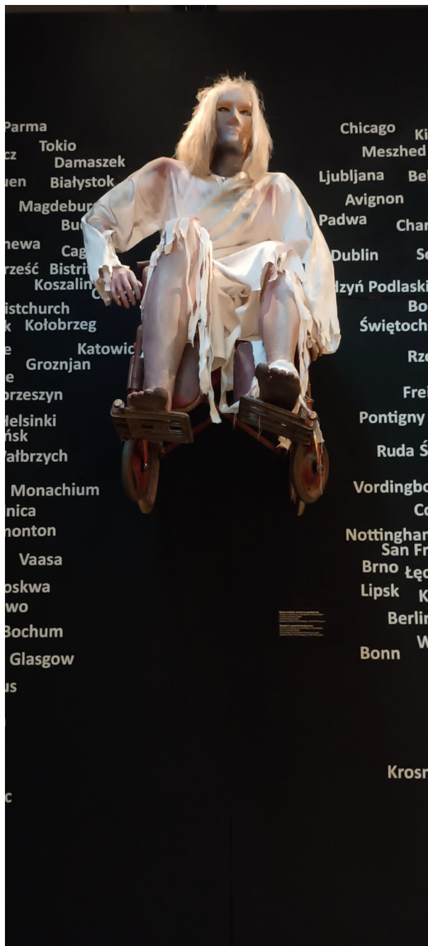
Fot. 1. Wystawa Światło i mrok . Teatr Leszka Mądzika, postać ze spektaklu Ikar , fot. I. Brandys, Katowice 2025