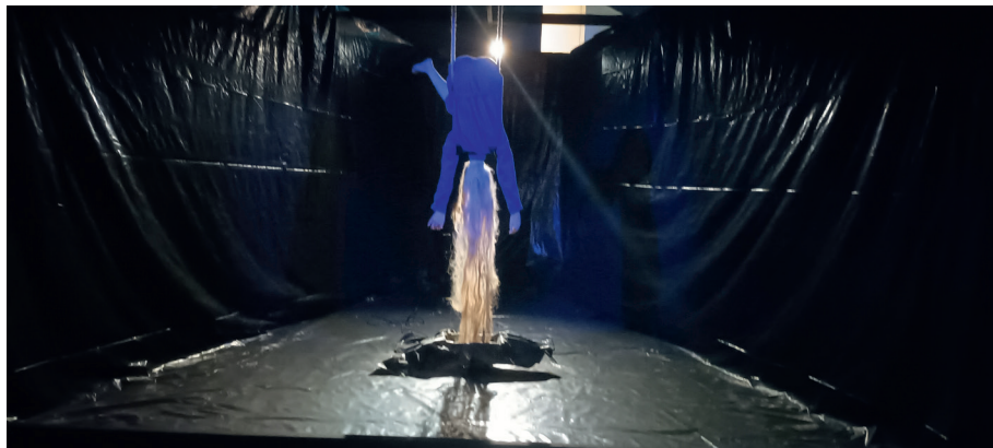
Fot. 8. Wystawa Światło i mrok . Teatr Leszka Mądzika, rekonstrukcja fragmentu sceny ze spektaklu Wilgoć , fot. I. Brandys, Katowice 2025