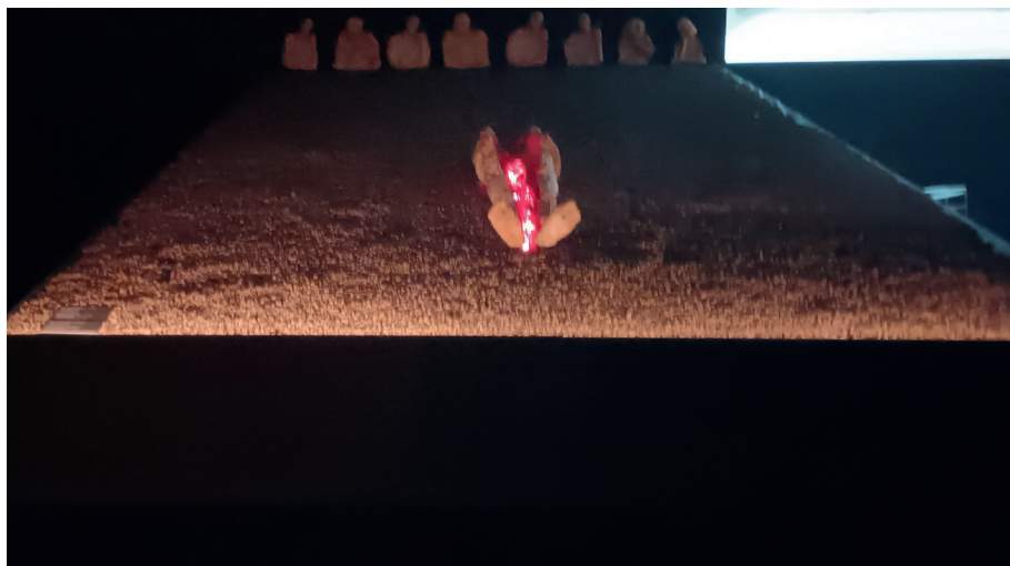
Fot. 7. Wystawa Światło i mrok . Teatr Leszka Mądzika, rekonstrukcja fragmentu sceny ze spektaklu Tchnienie , fot. I. Brandys, Katowice 2025