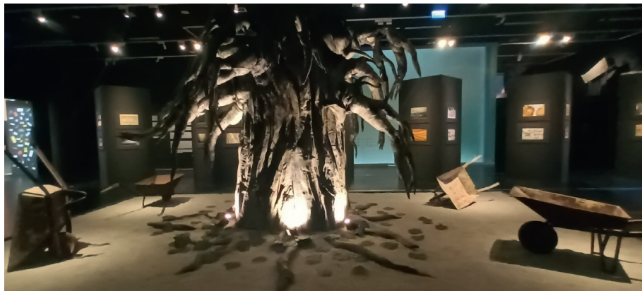
Fot. 4. Teatr Leszka Mądzika , rekonstrukcja fragmentu sceny ze spektaklu Kres , fot. I. Brandys, Katowice 2025