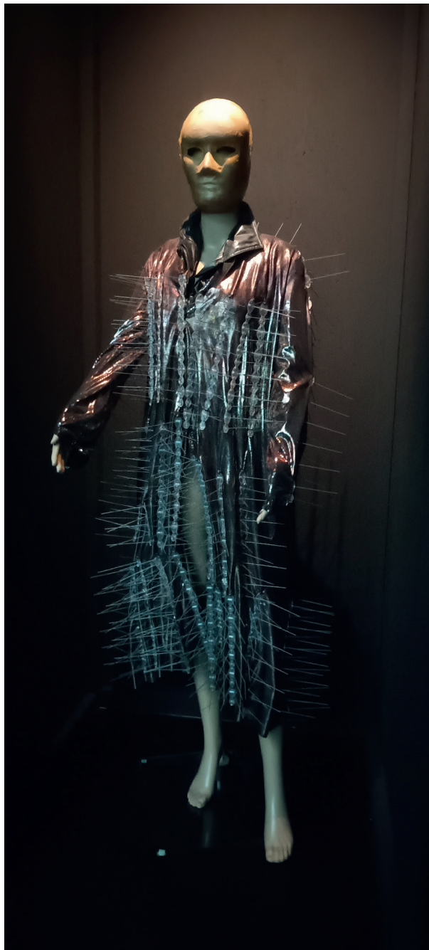
Fot. 3. Wystawa Światło i mrok . Teatr Leszka Mądzika, postać ze spektaklu Blask , fot. I. Brandys, Katowice 2025