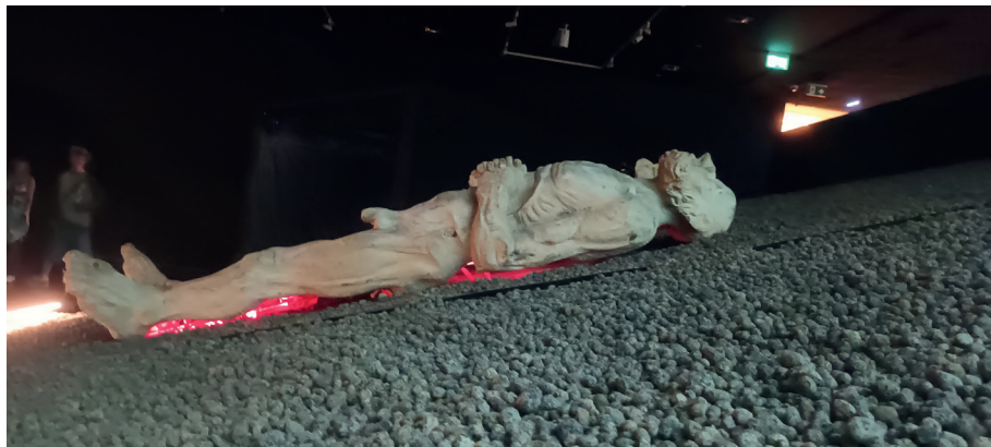
Fot. 6. Wystawa Światło i mrok . Teatr Leszka Mądzika, rekonstrukcja fragmentu sceny ze spektaklu Tchnienie , fot. I. Brandys, Katowice 2025