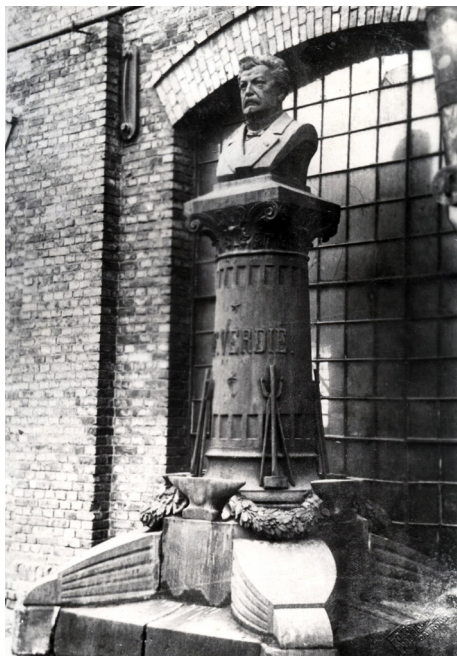
Fot. 2. Frédéric-Auguste Bartholdi, François-Félix Verdié , 1879; popiersie upamiętniające pierwszego dyrektora ustawione przed halą fabryczną Huty Bankowej; fotografia z albumu zakładu, oprac. Antoni Pilecki; kolekcja Muzeum Miejskiego „SztYGarka”