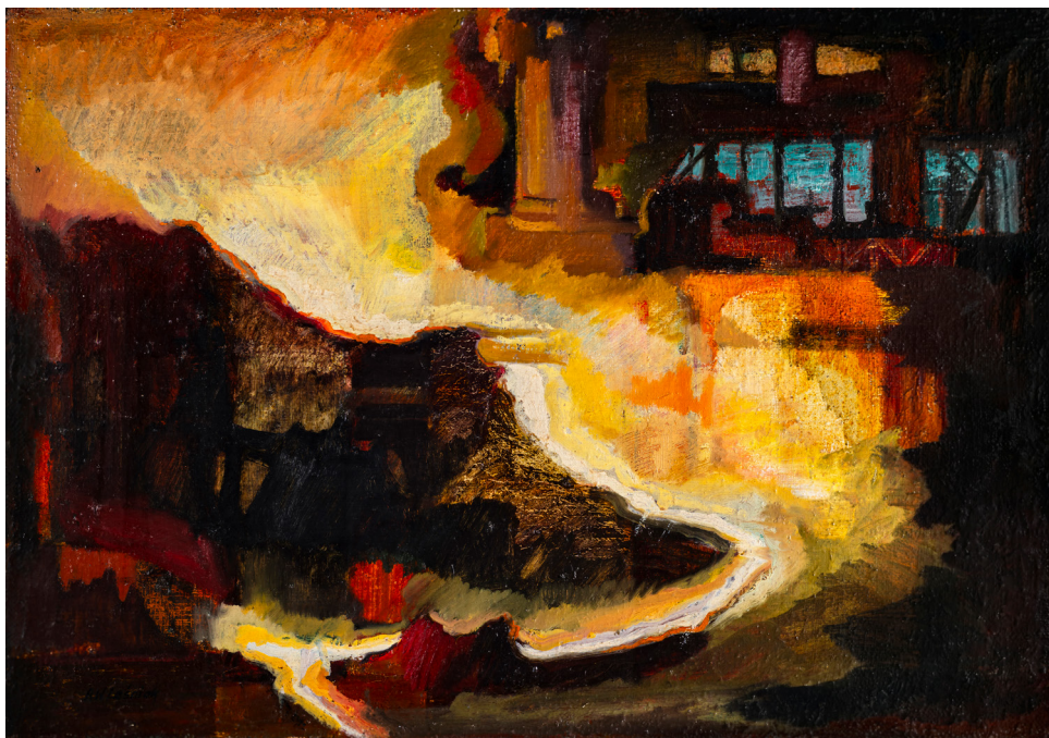
Fot. 3. Alina Wójcik-Leśniak, Wytop , olej na płótnie, niedatowany; kolekcja Muzeum Miejskiego „SztYGarka”

ludzkich rąk i umysłów, stworzyć trwałe wartości ideowo-artystyczne wzbogacające współczesną sztukę socjalistyczną” 10 .